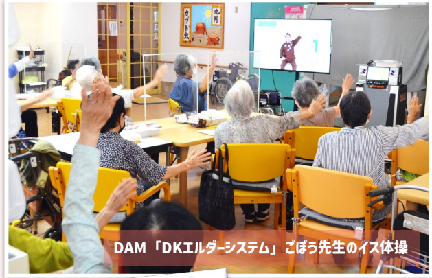
DAM「DKエルダーシステム」ごぼう先生のイス体操