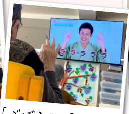
「ごぼう先生」が贈る →