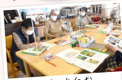
みんなで取り組む「おとなの学校」

大人気の「おとなの学校」そしてDAM「DKエルダーシステム」によるイス体操はじめ、往復100メートル強の廊下を使用した歩行訓練、フットペダルといった器具を利用したトレーニングなど豊富なサービスをご用意。ご利用者の状態に応じて機能訓練のプロPTからレクチャーを受けた介護士が適切なプログラムを提供いたします。毎月のカレンダーづくりはじめ、レクリエーションや季節の行事・外出も充実しています。