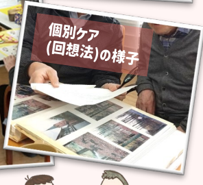
個別ケア(回想法)の様子