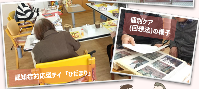
認知症対応型デイ「ひだまり」

「愛の園デイサービスひだまり」は認知症の方のためのデイサービス。 愛の園デイと同じフロアの奥に落ち着いたお部屋をご用意。少人数・顔な じみの関係の中でその人らしさを尊重し、手厚いケアを行っています。 通い慣れた愛の園デイから「ひだまり」へのご利用変更も可能です。