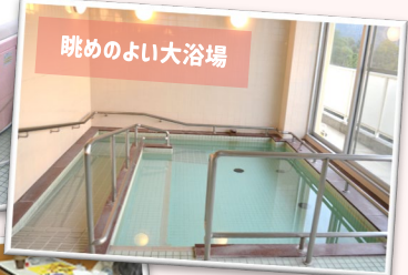
眺めのよい大浴場