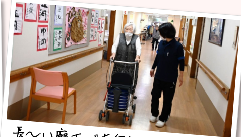
長〜い廊下で歩行訓練。何度も往復する強者もあり!!