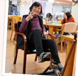
あしから元気にフットペダル