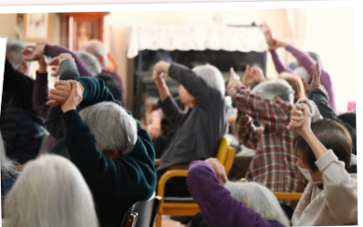
イス体操でしっかり身体を動かす！