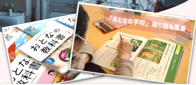
「おとなの学校」取り組み風景

大人気！毎日30分の授業で認知機能刺激「おとなの学校」 & DAM「DKエルダーシステム」による機能訓練・フレイル予防 いくつになっても学ぶことは楽しい!!「おとなの教科書」を使いさまざまな 授業で認知機能・ADL改善につとめます。DAM「DKエルダーシステム」 ではごぼう先生監修のイス体操でしっかり身体を動かします。ほかにも たくさんのプログラムが充実。 詳しくは裏面をご覧ください ➡