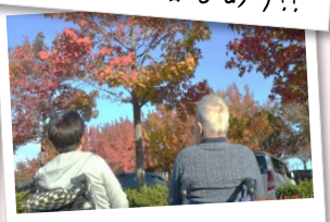
行楽の季節には外出へ