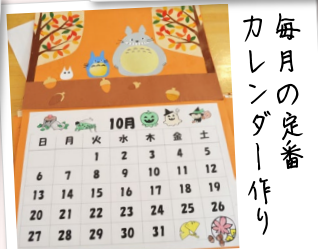
毎月の定着カレンダー作り