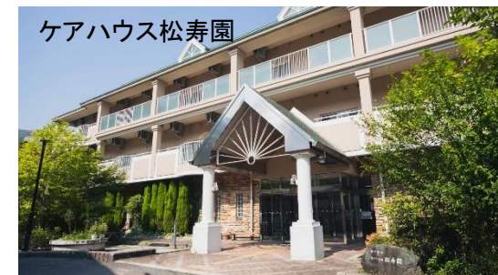
ケアハウス松寿園

ラファ愛の園訪問看護ステーションの事務所は神戸市長田区丸山町のケアハウス松寿園内に構えます。